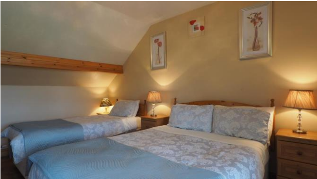
Stoney Haven B&B