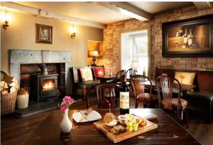
Hylands Burren Hotel